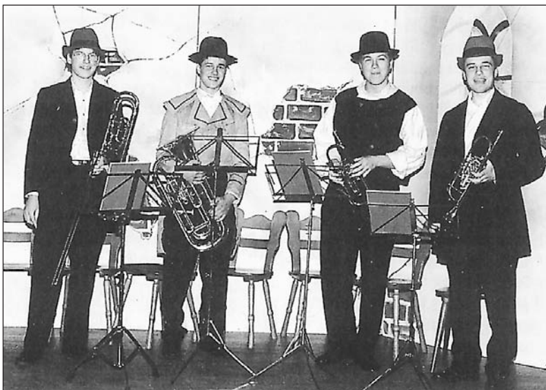
Bei der Redoute 1998 im Gasthof Kriechbaumer

EINLADUNG - EINLADUNG - EINLADUNG - EINLADUNG - EINLADUNG - EINLADUNG