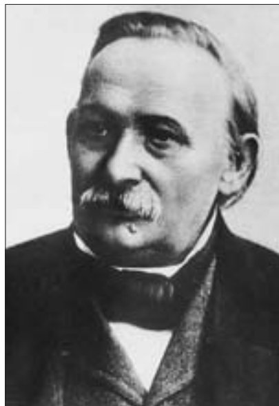
F. M. Böhme, nach einem undatierten Foto

Böhme, der u.a. durch sein "Altdeutsches Liederbuch" (Leipzig 1877) ausgewiesen war, hatte es eilig. Seine für die Zeit um und nach 1900 grundlegende Edition ist viel gescholten worden wegen verschiedener Ungenauigkeiten und mancher 'Fehler'. Die Ausgabe bleibt aber nicht nur wegen der