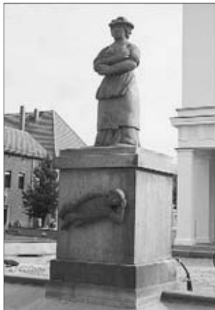
"Sabinchen-Brunnen" in Treuenbrietzen, eingeweiht am 6. Oktober 1984