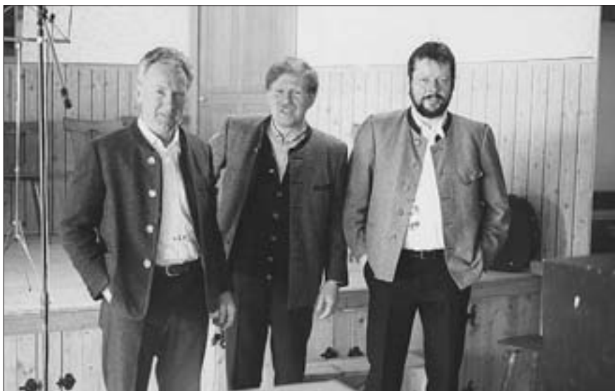
Die Walchschiemied-Sänger am 7. März 1993 bei Aufnahmen von geistlichen Volksliedern für das Volksmusikarchiv im Trachtenheim Hilttenkirchen.

Lied zum Fest "Christi Himmelfahrt" aus der Slg. Scheierling (von Deutschen aus der Ukraine), Satz nach den Walchschiemied-Sängern 1993, Neufassung des Textes auf der Grundlage der Hl. Schrift (Mt. 28,20 und Apostelgeschichte), EBES 1992.