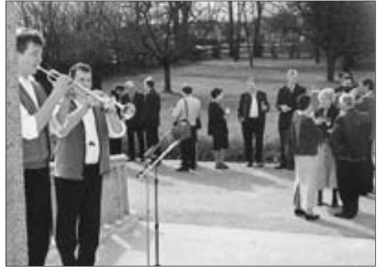
Blech-Intraten für die Ankommenden