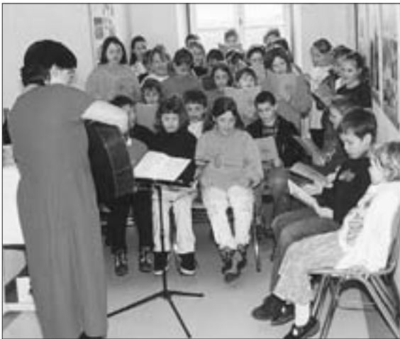
Kinder aus Vagen und Mittenkirchen singen ein Ständel