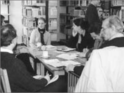
Pressetermin am 22. März 2000

Zwischen 900 und 1000 Bürgerinnen und Bürger nahmen die Gelegenheit wahr, anlässlich der Einweihung und Eröffnung das neue Gebäude für das Volksmusikarchiv des Bezirks Oberbayern zu besuchen und zu besichtigen. Über 500 Interessenten haben sich bei Archivführungen über die Aufgaben und Bestände des Volksmusikarchivs informieren lassen. Dabei kam es zu vielen schönen Begegnungen und trotz der vielen Menschen zu manch fruchtbarem Gedankenaustausch.