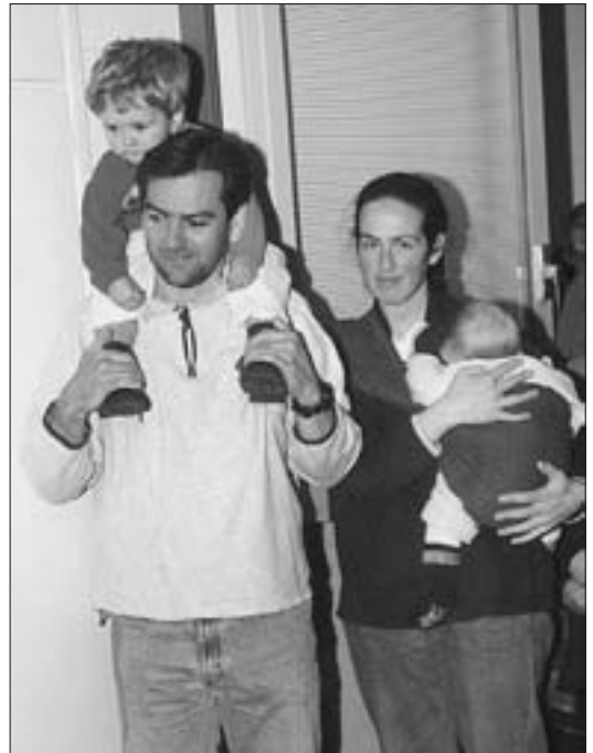
... Alt und Jung