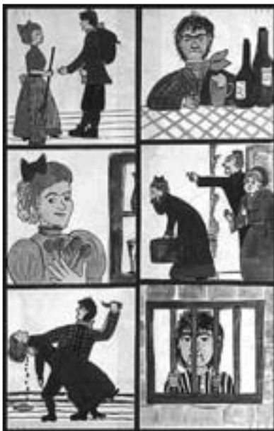
Neue Moritatentafel im Volksmusikarchiv zur Moritat von Sabinchen, EB 1992