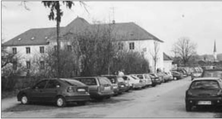
Autos, Autos, Autos ... und ein übervoller Parkplatz