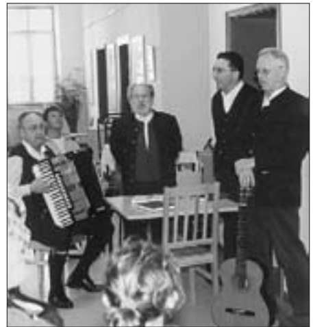
Die Schanzer Sängler aus Ingolstadt kamen am Samstag