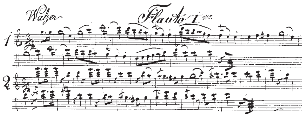
Walzermelodien für "Flauto Imo" aus einem Ländlerbuch für 2 Flöten (Nachlaß Berr, Rosenheim)

Peter Denzler übt Stücke für 9-stimmige reine Blechmusik aus den Notenhandschriften der Stadtmusikerfamilie Berr ein. Neben diesen städtisch geprägten Besetzungen sind auch Noten für eher ländliche Spielgelegenheiten im bäuerlichen Umfeld in Berr's Nachlaß enthalten: Ländlerbücher und Schottische für 2 Melodiestimmen (2 Klarinetten, 2 Trompeten oder 2 Flöten), bei denen Begleitung und Baß traditionell auswendig dazu gespielt wurde. Auch eine Auswahl dieser Melodien, die Berr wohl gegen Entgelt für ländliche Musikanten aus der Umgebung Rosenheims aufgeschrieben hat, werden heuer zum Klingen gebracht.