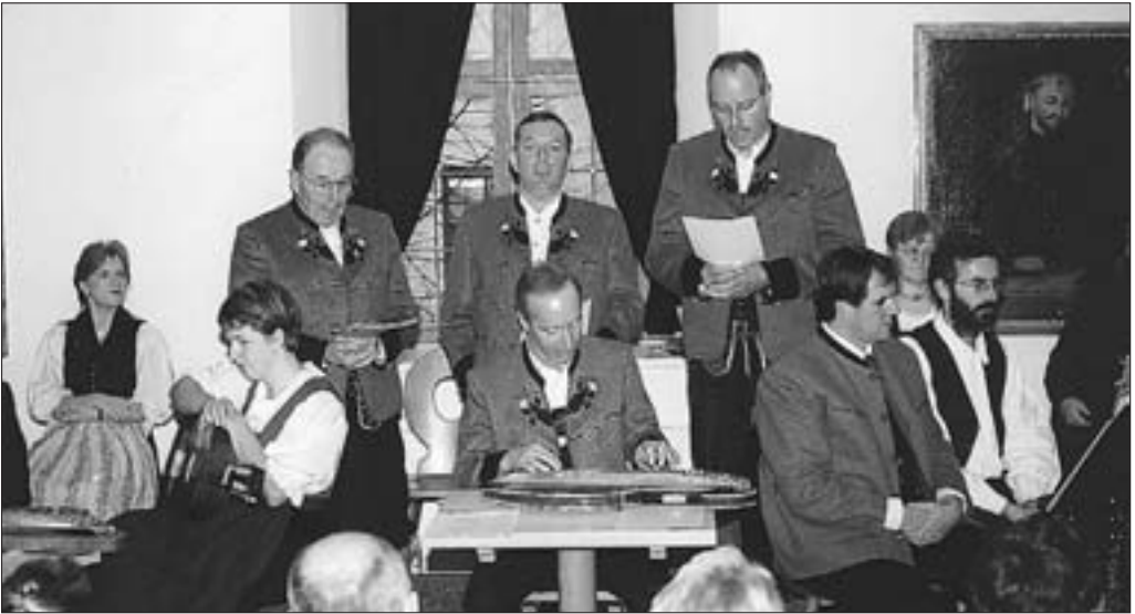
Sänger und Musikanten bei der Matinee im Festsaal von Kloster Seeon am 19.12.1999, Rohrdorfer Sänger (Mitte)