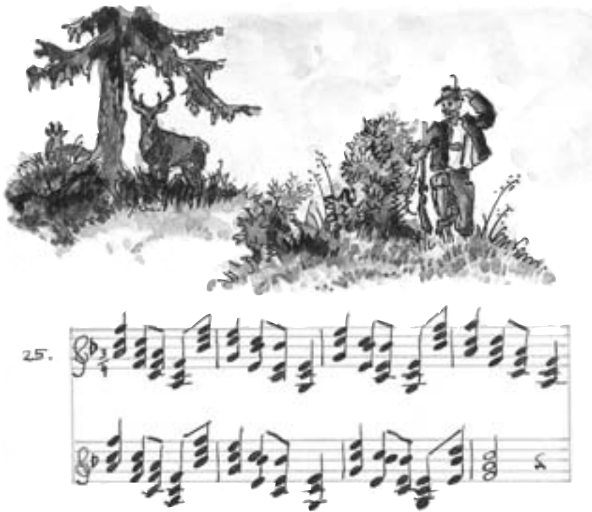
"Lustig is Buasein, i tausch mit koan Mo ..." Ausschnitt mit Melodie und Aquarell, Ruhpolding 1941, Lied Nr. 25 (Original in Farbe).

Die Herausgabe des Liederbuches von Marianne von Kaufmann soll zum einen ein Stück regionaler musikalischer Volkskultur in Oberbayern dokumentieren. Zum anderen möchte der Bezirk Oberbayern aber auch zum eigenen aktiven Tun, zum Selbersingen anregen. Vielleicht versuchen Sie selbst, ein Liederbuch mit den von Ihnen gesungenen Liedern anzulegen? Das Volksmusikarchiv und die Volksmusikpflege des Bezirks Oberbayern hilft Ihnen gern dabei."